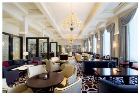
ロビーラウンジ イメージ

2012年の東京ステーションホテルのリニューアルオープン時に誕生。イギリスのリッチモンド・インターナショナル社が手掛けたインテリアデザインは、ヨーロピアンクラシックにモダンデザインが程よく溶け込み、エレガントで洗練された空間です。プレミアムブレイクファストからホテルメイドのスイーツ、ランチ・ディナーをご用意しているほか、今年5月からは夕方のお茶会「ハイティー」の販売を開始。当ホテルのレストラン&バーのなかで最も多くのお客様にご利用いただいている店舗です。