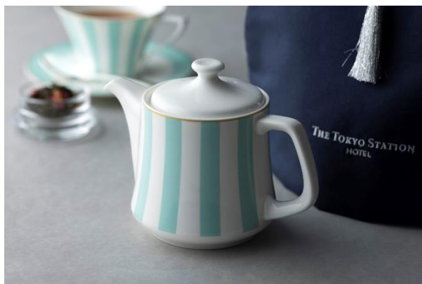
ティーポット イメージ

「ティーカップ&ソーサー」と「ティーポット」は、ホテル1階にあるロビーラウンジでフレイバーティーなどをご提供する際に使用しているテーブルウェアです。無駄のないシェイプと鮮やかなカラーリングが織りなすタイムレスな美しさで、多くのお客様からの購入希望を絶えず頂戴したことから、この度ホテルのオンラインショップで販売することとなりました。