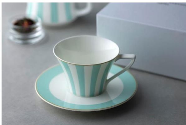
ティーカップ&ソーサー イメージ

東京駅丸の内駅舎のなかに位置する東京ステーションホテル（所在地：東京都千代田区丸の内1-9-1）は、ホテルオリジナルデザインの「ティーカップ&ソーサー」と「ティーポット」を、公式オンラインショップ限定で、2021年11月1日(月)10:00より販売いたします。