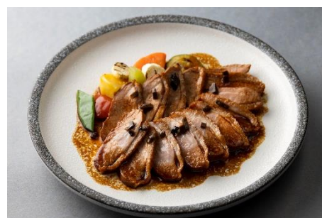
「お惣菜5種セット」の合鴨和風ロースト イメージ

2021年9月に開設。ステーションナリーセットの「文豪セット」やお洒落な「ミニトートバッグ」など、人気のオリジナルグッズのほか、総料理長考案の食卓を彩る「お惣菜5種セット」やレトルトの「黒毛和牛欧風カレー」「黒毛和牛ビーフシチュー」など、幅広い商品をラインナップ。大切な方への贈り物やご自宅での普段使いで、おうち時間がさらに贅沢なひとときになります。販売アイテムは今後も順次増やしてまいります。