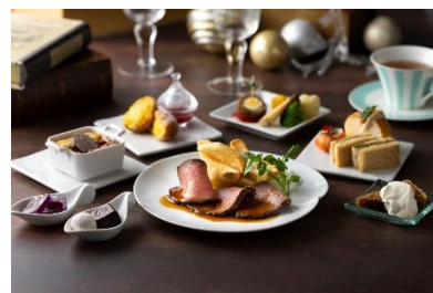
「トワイライト ハイティー」 イメージ

〈ロビーラウンジ〉で人気の「トワイライト ハイティー」を特別プランでご用意。「ハリー・ポッターと魔法の歴史」展の特別観覧券が付くこのハイティーは、“英国”がテーマ。イギリスで親しまれているメニューを中心にセイボリー6種とスイーツ5種の組み合わせです。ウェルカムドリンクのグラスシャンパーニュのほか、14種の紅茶やコーヒーをお好きなだけ。駅舎の中で優雅なひとときをお過ごしいただけます。