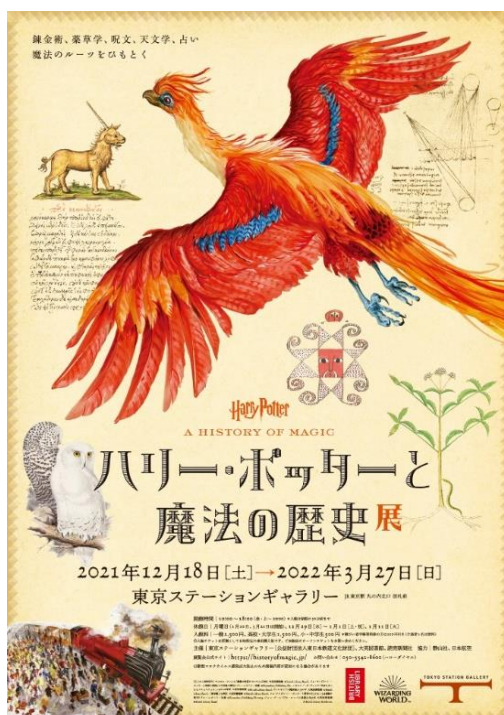
「ハリー・ポッターと魔法の歴史」展 イメージ

東京駅丸の内駅舎の中に位置する東京ステーションホテル（所在地：東京都千代田区丸の内 1-9-1）は、同じく駅舎内にある東京ステーションギャラリーでの「ハリー・ポッターと魔法の歴史」展の開催を記念し、特別観覧券付きの宿泊プランを12月1日(水)から販売いたします。