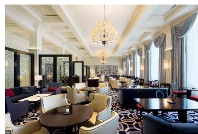
〈ロビーラウンジ〉 イメージ

https://www.tokyostationhotel.jp/event/historyofmagic2021/