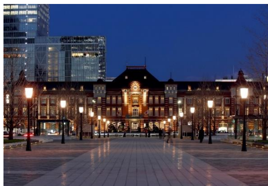
東京ステーションホテルが位置する東京駅舎 イメージ

東京で現存するホテルとしては2番目に歴史があり、国指定重要文化財の中にすべてが位置するホテルとして国内唯一。また、発着列車本数日本一の東京駅舎に位置し、首都圏はもちろん国内各地への移動にも便利で、他に類を見ない理想的なロケーションを誇ります。