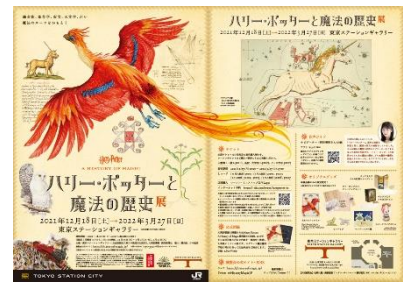
展示内容 イメージ

大英図書館の大規模な展覧会が日本に巡回するのは初めてであり、その充実したコレクションの一端をご覧いただける絶好の機会となります。