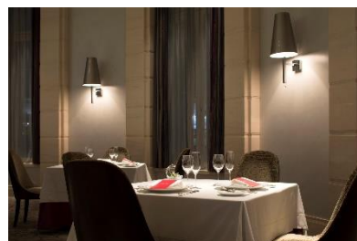
レストラン〈ブラン ルージュ〉 イメージ

＊「ハリー・ポッターと魔法の歴史」展の宿泊プランをご利用いただいたお客様も対象となります。