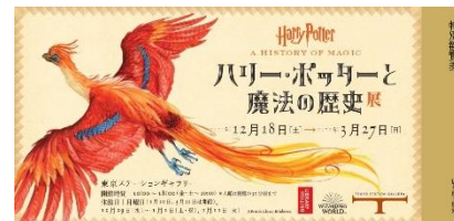
特別観覧券 イメージ

＊特別観覧券はホテル滞在中、「ハリー・ポッターと魔法の歴史」展を1回ご覧いただくことができます。