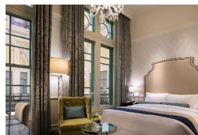
「ドームサイドコンフォートキング」 イメージ